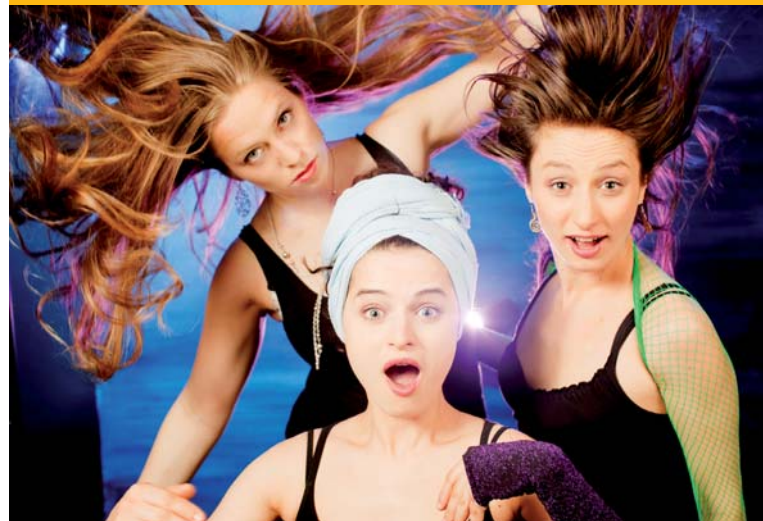
Netnakisum (A) bei der Flensburger Hofkultur